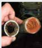
Sistema de tuberías