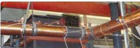
Vulcan S250 instalado en el Hospital St. Joseph

Sin duda, recomiendo sin duda alguna la unidad instalada de Vulcan S250 por CWT GmbH."