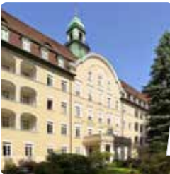
Hospital de St. Joseph, Berlín